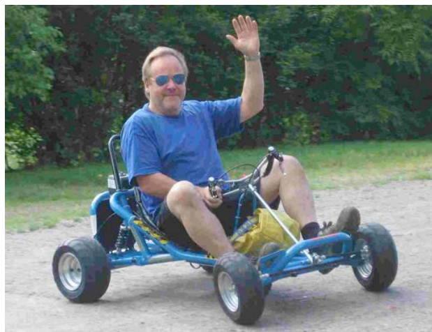
Kör han på bi-fuel, männe?