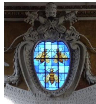
Kyrkfönster i kyrkan Santa Maria in Aracoeli i Rom.